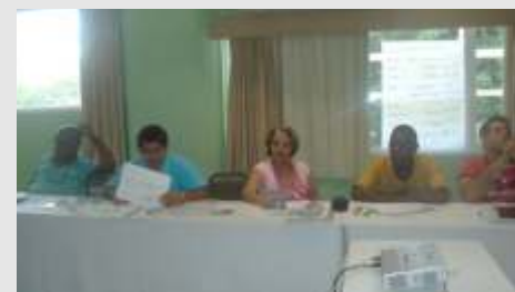
Teca participa de GTN sobre regulamentação da GDASS

Para regulamentar o Decreto nº 6.493, de 30 de junho de 2008, que dispõe sobre implantação da Avaliação de Desempenho das Atividades do Seguro Social, o governo, por meio da portaria 244, de agosto de 2008, instalou o Grupo de Trabalho Nacional, cujo objetivo é propor os critérios para a implementação da avaliação e uma proposta de regulamentação da jornada de trabalho. O GTN ficou sob a coordenação da Secretaria