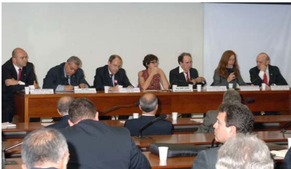
Comissão do Trabalho da Câmara aprova Convenção 151

A Comissão de Trabalho, de Administração e Serviço Público aprovou no dia 03.12.08, o Projeto de Decreto Legislativo (PDC) 795/08, que aprova a Convenção 151, da Organização Internacional do Trabalho (OIT), e o seu complemento o seu complemento, a Recomendação 159, ambas de 1978.