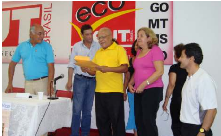
Diretores do SINTFESP e trabalhadores entregam documento pedindo revisão das Tabelas Salariais ao presidente nacional da CUT

Mesmo com a pressão dos trabalhadores da Seguridade Social, a Câmara dos Deputados rejeitou todas as emendas apresentadas pelo movimento sindical, para garantir seus direitos e corrigir injustiças do texto. O Senado manteve a decisão dos e aprovou a MP 431/08, transformada em Lei 11.784, sem levar em consideração as emendas dos servidores da Seguridade Social, com isso milhares de servidores estão prejudicados. A lei foi sancionada pelo presidente Lula no dia 22 de setembro de 2008.