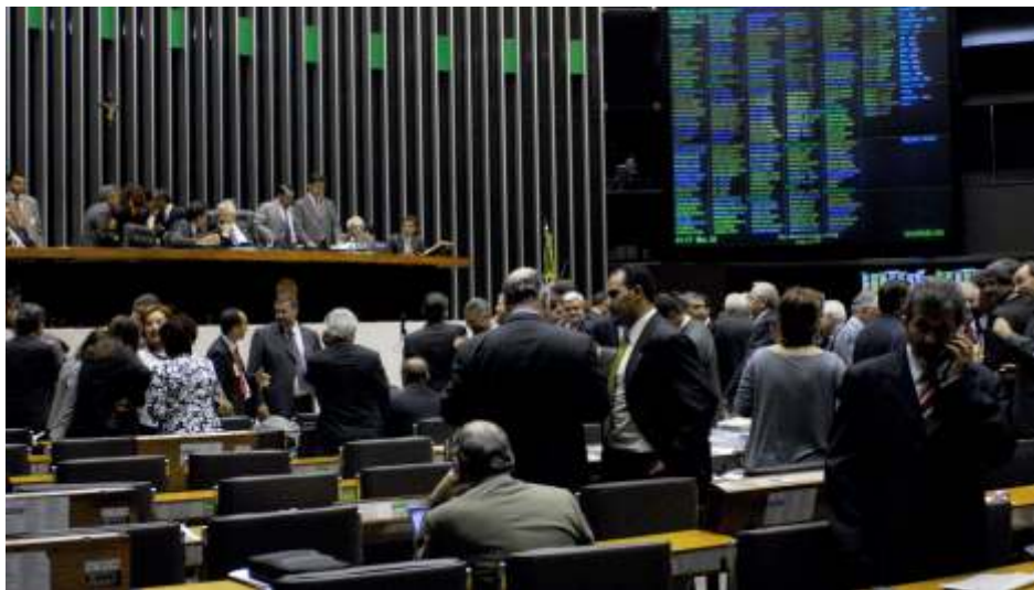
Deputados votam MP 441